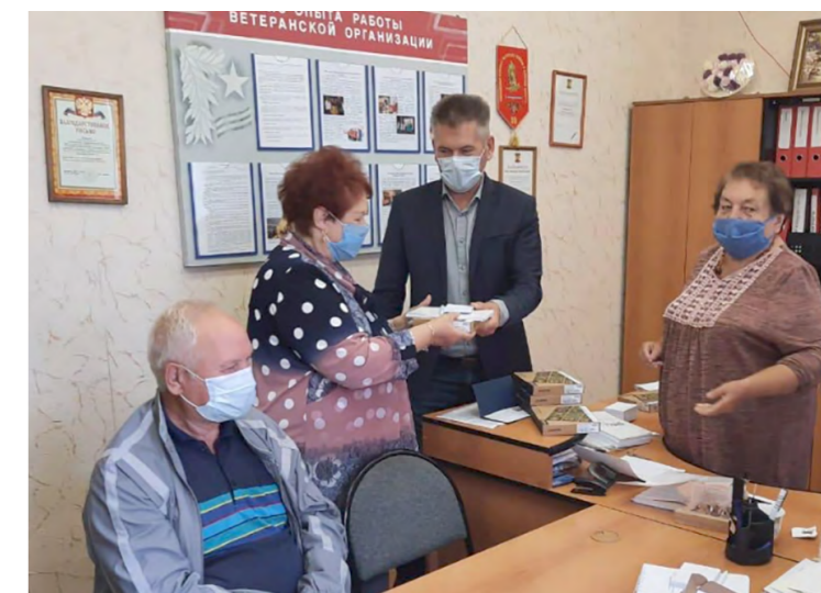
Вручение планшетов в г. Удомля 2020 год

Сайт проекта: https://www.slava-sozidatelyam.ru