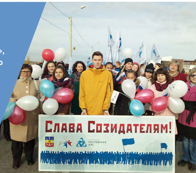
Парад Созидателей в г. Волгодонск 2018 г.

Основными действующими лицами конкурса являются авторы – школьники и герои – ветераны, внесшие вклад в развитие атомной отрасли и становление городов присутствия Госкорпорации «Росатом». Одна из самых важных целей конкурса – сохранение преемственности поколений.