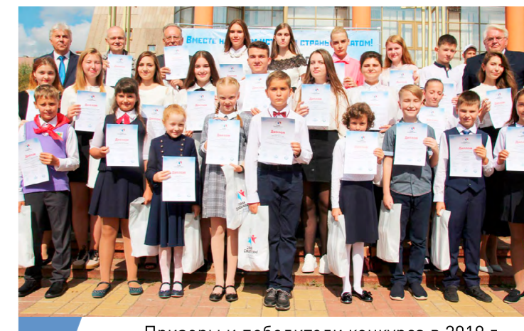
Призеры и победители конкурса в 2019 г. в одном из «атомных» городов.