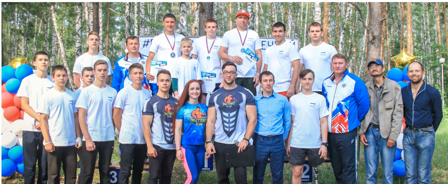
Атомный воркаут в г. Глазов 2019 г.