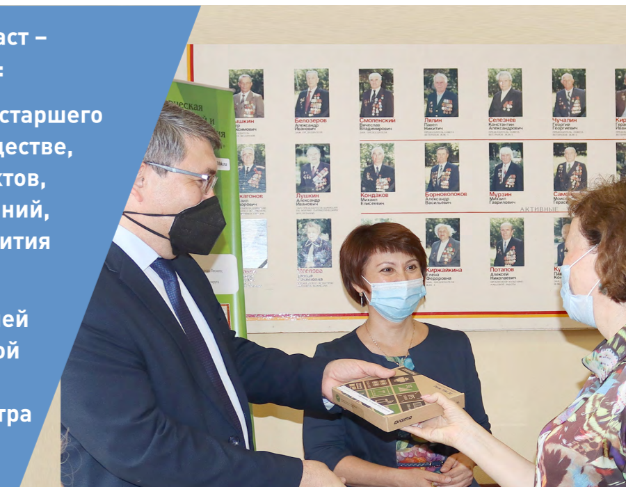
Вручение планшетов активным пенсионерам г. Лесной 2020 г.