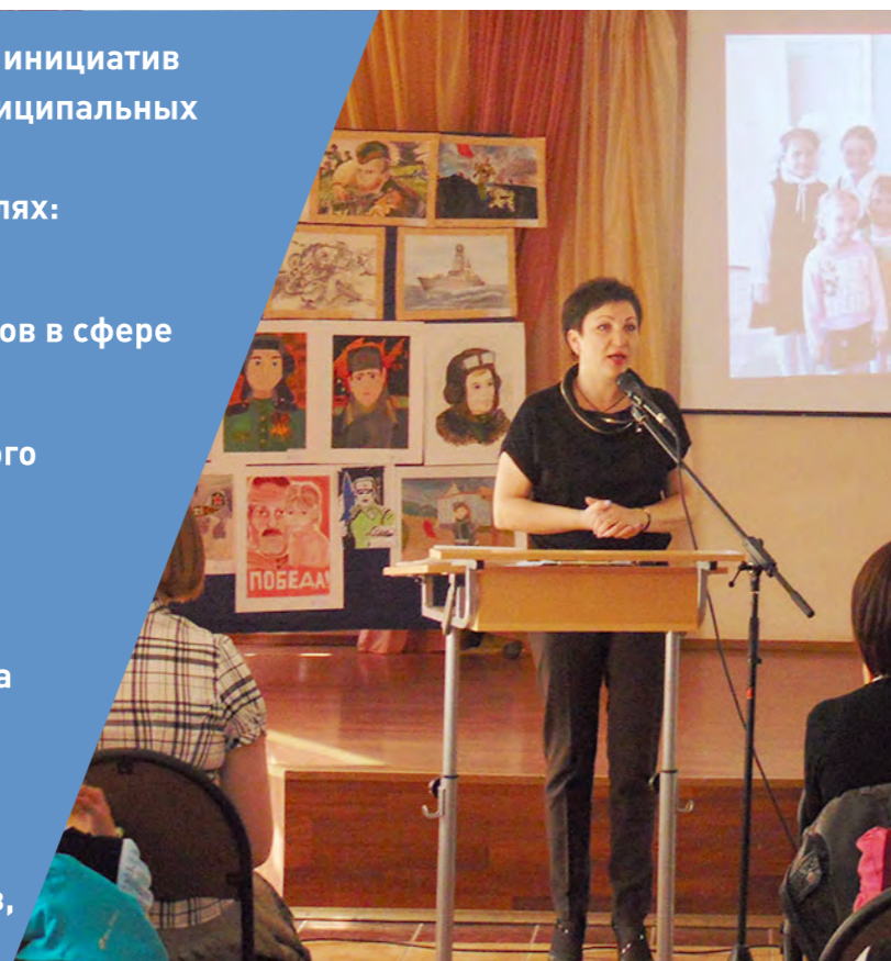
Практика: «Конкурс читающих семей: чтение, которое всех объединяет» (Удомельский городской округ Тверской области)