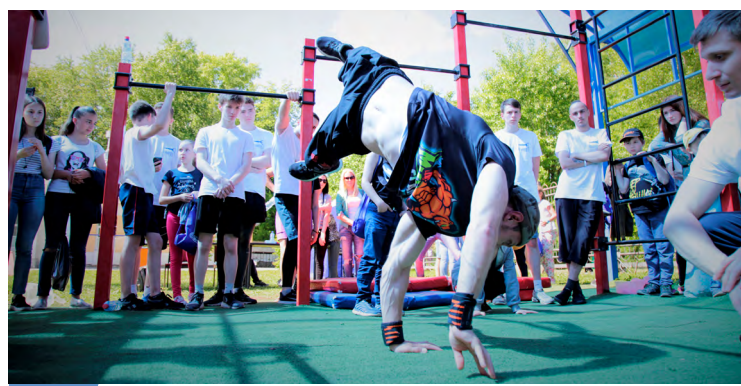
Атомный воркаут в г. Глазов 2019 г.