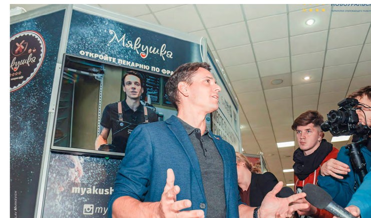
Практика форум-выставка «Новоуральск. Франчайзинг как драйвер развития потребительского рынка и предпринимательства современного муниципалитета и ЗАТО» г. Краснокамск