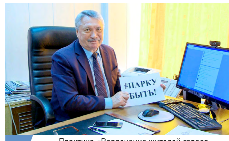
Практика «Вовлечение жителей города в решение вопросов развития городской среды» г. Краснокамск