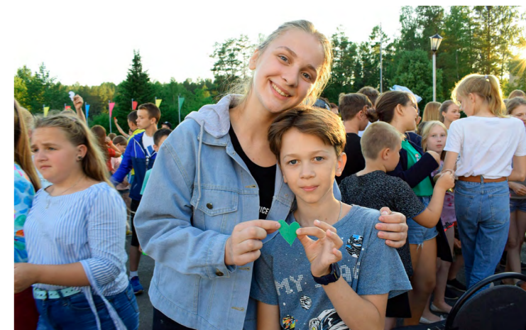
Практика «Волонтерская профориентационная стажировка для подростков 15-17 лет «Мой выбор» г. Лесной