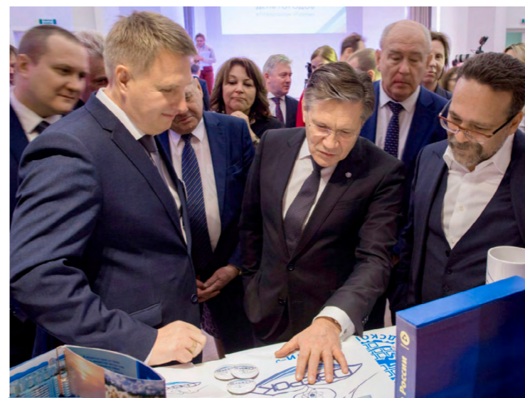
Генеральный директор Госкорпорации «Росатом» Алексей Лихачев на Дне атомных городов в 2019 г.