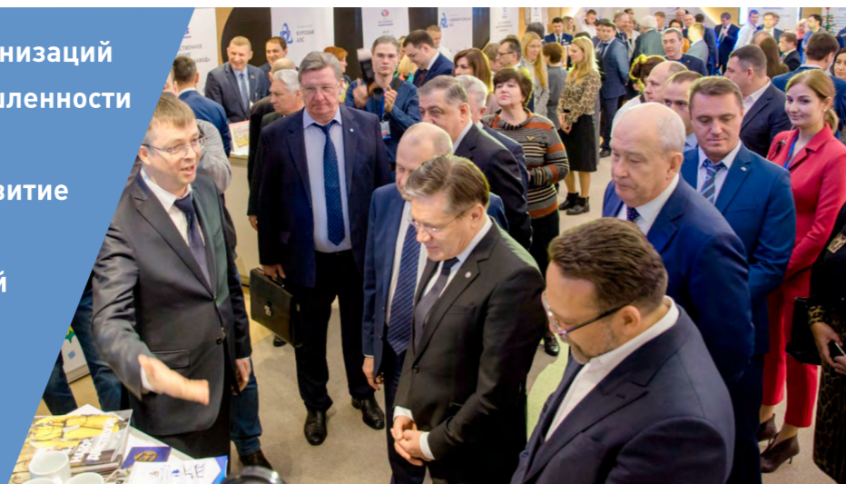
День атомных городов в 2019 г.

Цель – вовлечение работников организаций и жителей городов атомной промышленности в развитие ключевых направлений деятельности атомной отрасли, развитие корпоративной культуры, а также формирование единой эффективной среды для общения работников организаций Госкорпорации «Росатом» и жителей городов атомной промышленности.