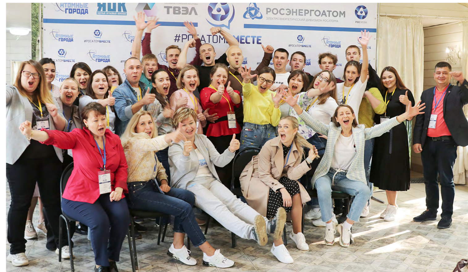
Участники молодежного Хакатона в Москве 2020 г.