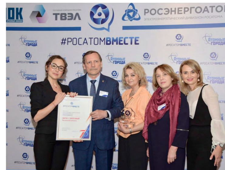
Награждение победителя #РОСАТОМВМЕСТЕ 2019 г. - г. Заречный Пензенской области.