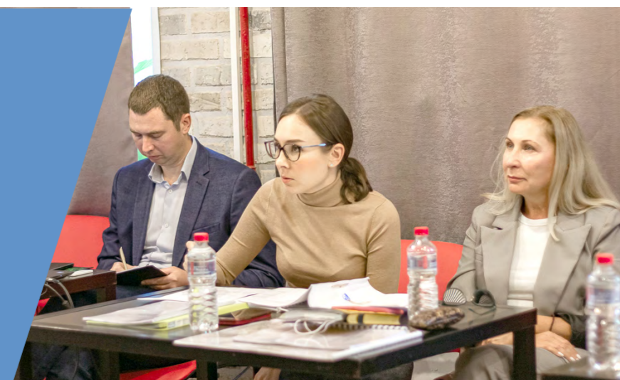
Акселератор социальных проектов в г. Глазов 2020 г.