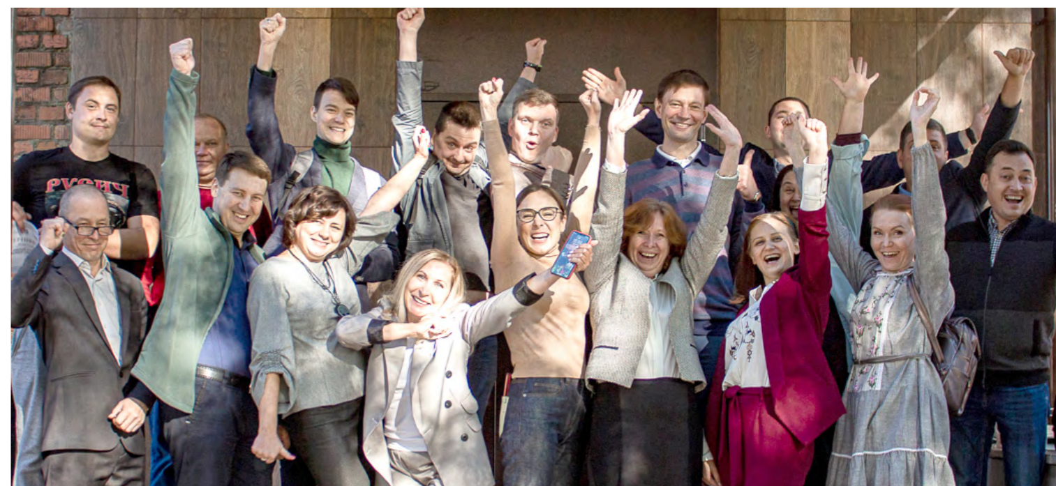
Акселератор социальных проектов в г. Глазов 2020 г.