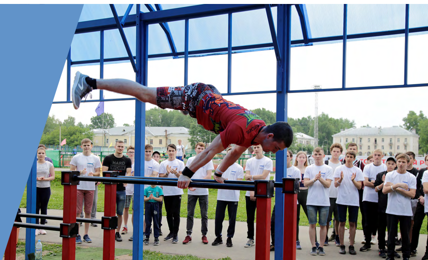
Атомный воркаут в г. Заречный Пензенской области 2019 г.

В программе турнира: силовые соревнования по воркауту, призовые конкурсы со зрителями, мастер-класс и шоу-программа от Федерации воркаута России.