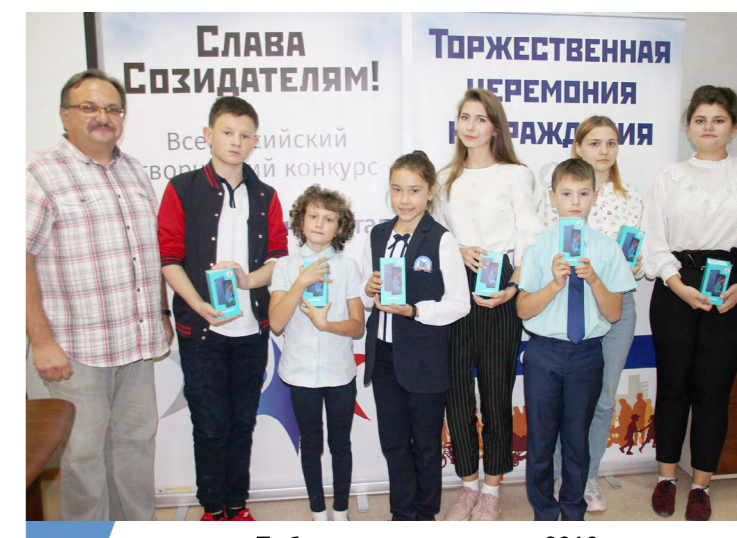
Победители конкурса в 2019 г. в одном из «атомных» городов.

Сайт проекта: https://www.slava-sozidatelyam.ru