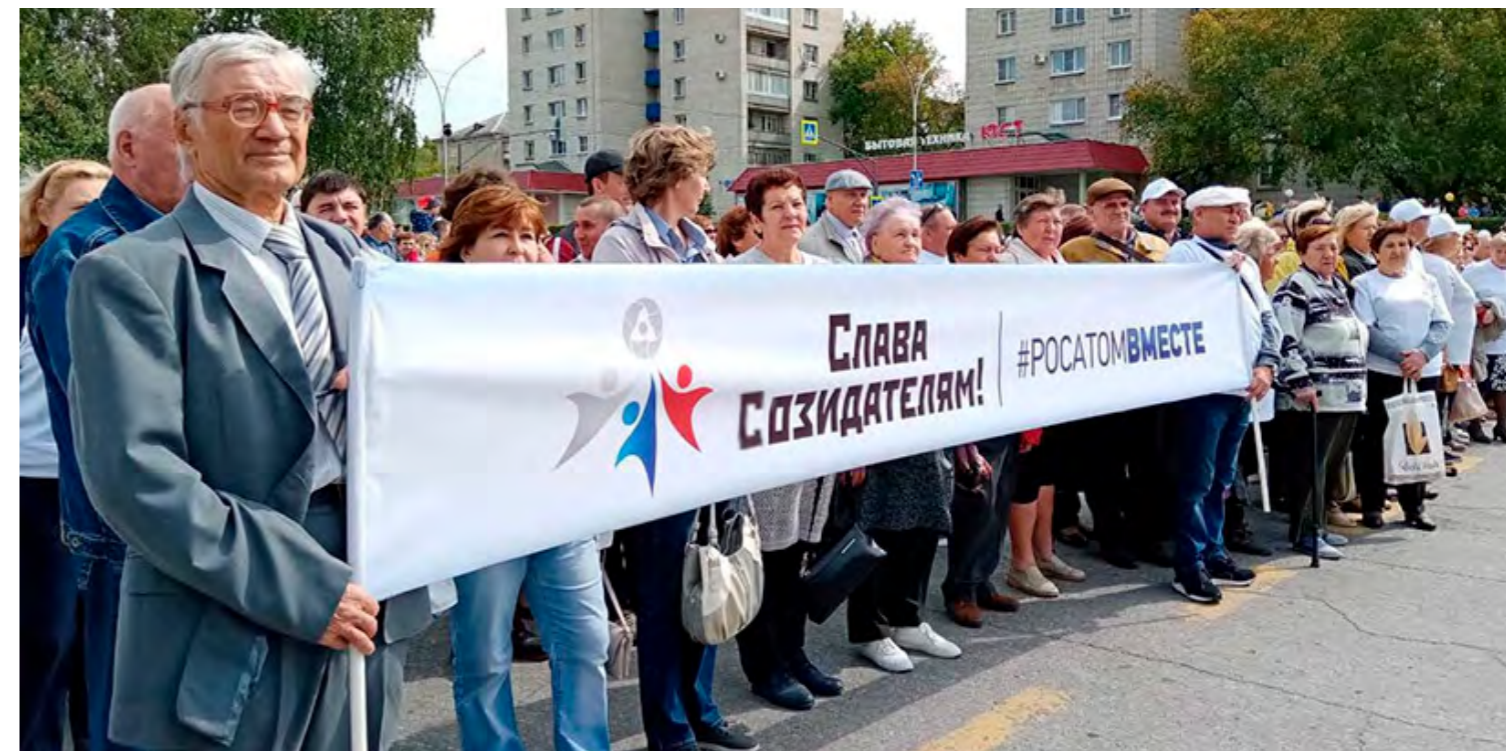
Парад Созидателей 2019 г.