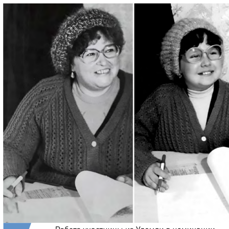
Работа участницы из Удомли в номинации «Один в один с Созидателем» 2020 г.

На сайте конкурса хранятся творческие работы и публикуются актуальные новости о проведении конкурса в городах.