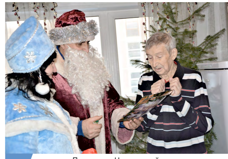
Практика «Новогодний подарок Железнодорожного хосписа» г. Железнодорожск