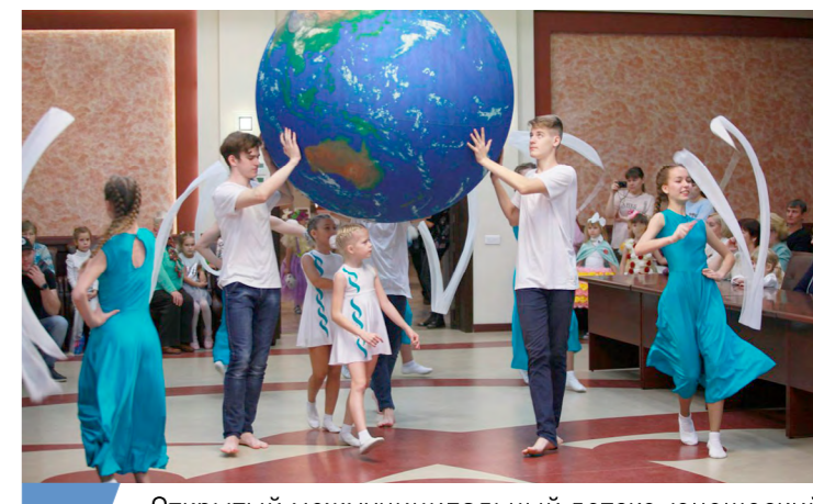
Открытый межмуниципальный детско-юношеский экологический фестиваль «GreenWay» в г. Балаково