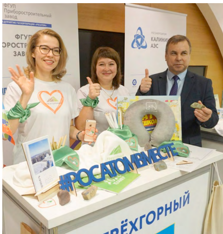
День атомных городов в 2019 г.