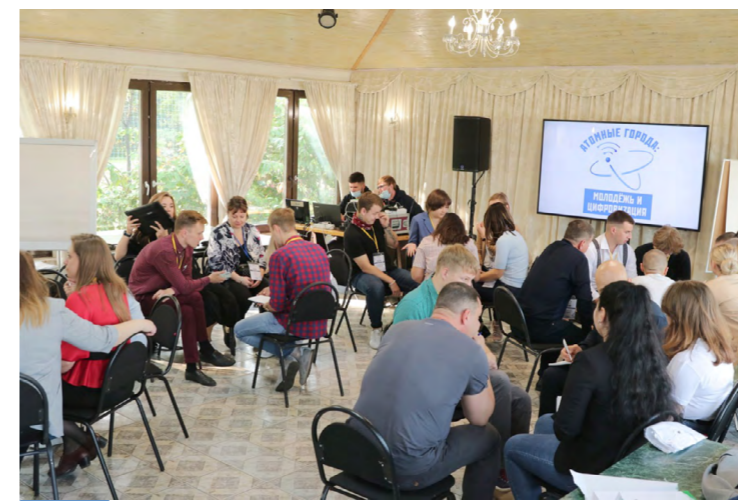
Участники молодежного Хакатона в Москве 2020 г.