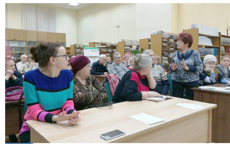
Практика «Школа ответственного собственника» г. Саров